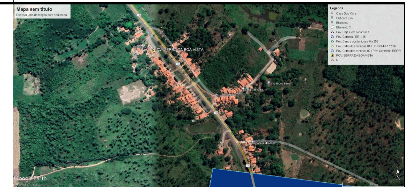
LOCALIZAÇÃO ESC: Sem Escala